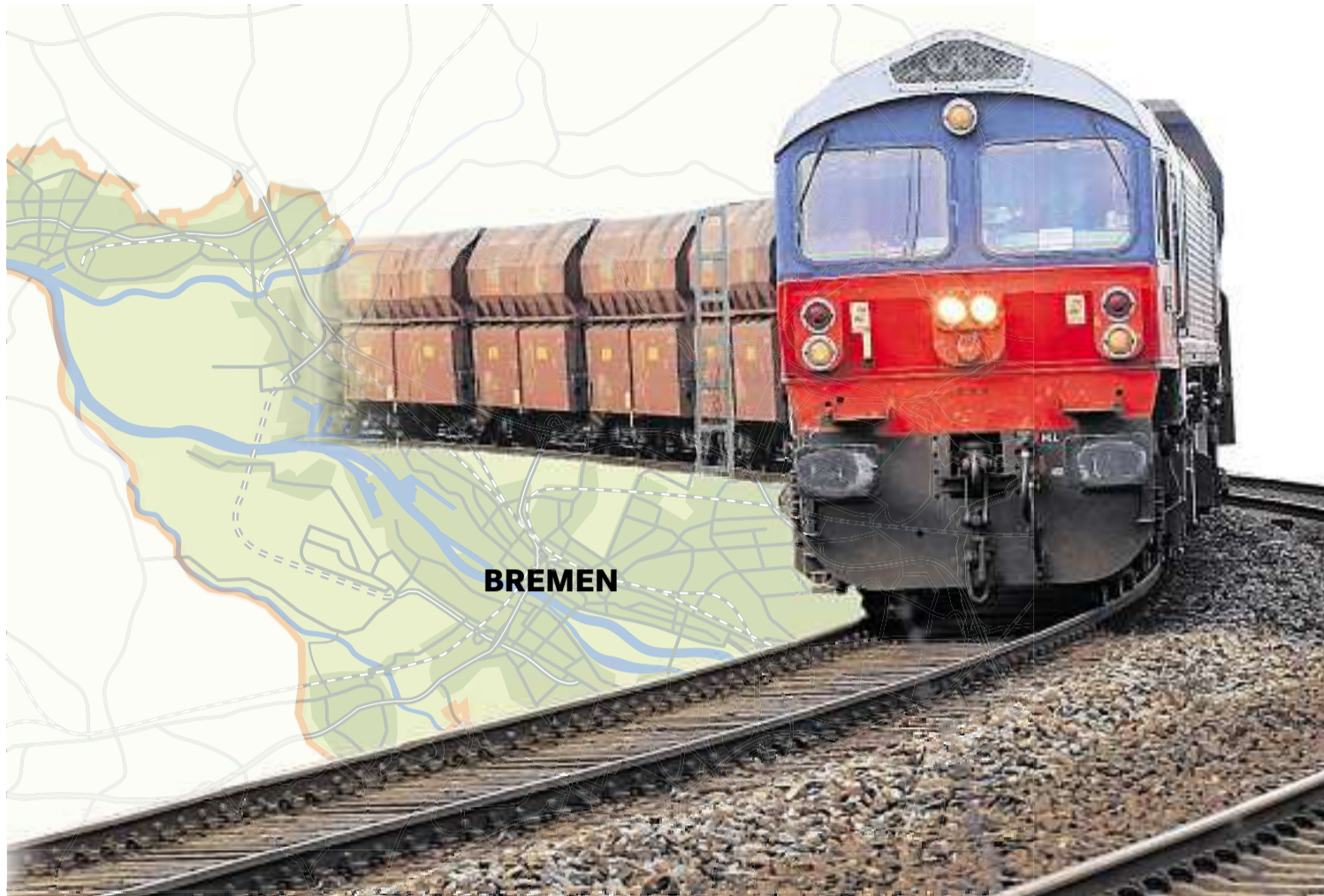
Während die Bahnärm-Initiative fürchtet, dass der Streckenausbau in und um Bremen mehr Güterzüge aufs Gleis bringt, sehen Befürworter der Pläne Vorteile für Pendler und andere Bahnfahrende, weil Personenzüge verlässlicher in kürzerem Takt fahren könnten.